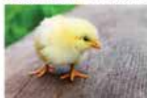
Libre de droit

Atelier de création de lapins, poussins en pompon pour enfants de 6 à 10 ans. Sur réservation à la Maison du Livre et de la Culture : 09 64 43 05 78